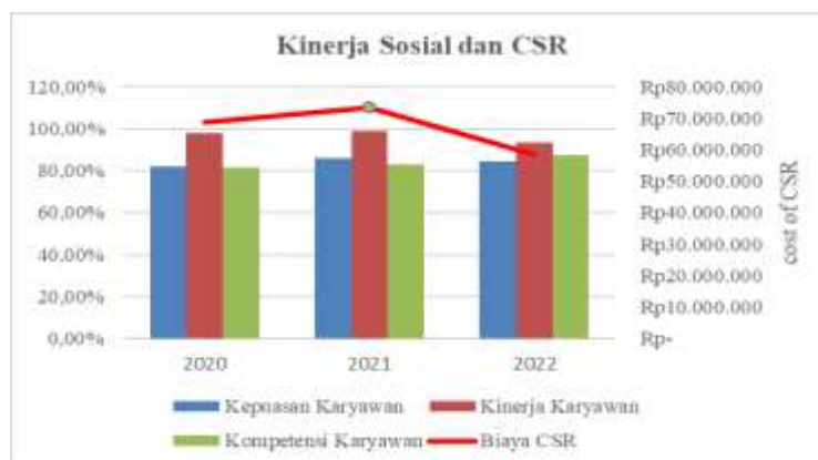
Gambar2 : Kinerja Sosial dan CSR

Kinerja perusahaan juga diukur dengan kinerja sosial di dalam penelitian ini. Pengungkapan dan pelaporan kinerja sosial merupakan bagian terintegrasi dari informasi kinerja yang dibutuhkan oleh stakeholder baik primary stakeholder maupun secondary stakeholder (Hadj, 2022). Penelitian ini menggunakan indikator kepuasan karyawan, kinerja karyawan serta kompetensi karyawan untuk melihat kinerja sosial perusahaan (Malectic et al, 2015).