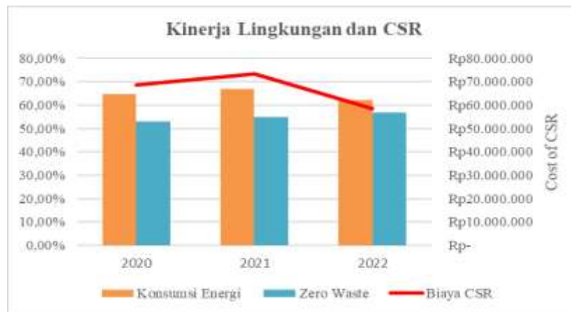
Gambar 3 : Kinerja Lingkungan dan CSR

CSR merupakan sebuah konsep yang mendasari hubungan antara perusahaan dengan lingkungan dan masyarakat. Gambar 3 menunjukkan keterkaitan kinerja lingkungan dengan CSR perusahaan. Kinerja lingkungan turut pula diperhitungkan dalam penelitian ini. Biaya konsumsi energi yang terdiri dari listrik, air dan bahan bakar minyak merupakan proporsi terhadap total biaya operasional yang dikeluarkan perusahaan dalam satu periode. Kebutuhan perusahaan akan energi seperti listrik dan bahan bakar minyak tidak banyak mengalami penurunan meskipun perusahaan telah menerapkan CSR. Komposisi biaya energi yang digunakan tidak banyak mengalami perubahan dikarenakan meskipun terkena dampak kebijakan pembatasan aktivitas masyarakat, operasional perusahaan tetap berjalan dan menggunakan energi listrik, air serta bahan bakar. Bentuk CSR yang telah dilakukan oleh perusahaan ini lebih pada bagaimana perusahaan mengelola limbah dan telah mendapat perijinan dari dinas terkait. Zero waste merupakan proporsi biaya yang dikeluarkan untuk bahan habis pakai terhadap total biaya operasional perusahaan. Angka zero waste dapat dikendalikan yang dimulai dengan pemberlakuan peraturan bagi karyawan untuk membawa alat makan dan minum sendiri dan juga mengurangi penggunaan kertas dalam operasional bisnis perusahaan.