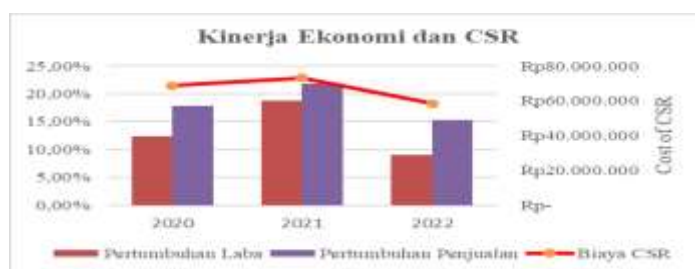
Gambar 1 : Kinerja Ekonomi dan CSR

Kinerja ekonomi adalah indikator pencapaian ekonomi yang diberikan perusahaan kepada para stakeholder. Kinerja ekonomi biasanya diukur menggunakan indikator keuangan. Penelitian ini menggunakan proksi pertumbuhan laba dan pertumbuhan penjualan untuk menggambarkan pencapaian kinerja ekonomi perusahaan (Malectic et al, 2015).