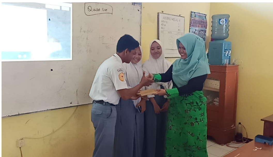
Gambar 5. Pemberian Hadiah untuk Pemenang Quizlet

Ketika pemenang sudah ada, kuis dihentikan. Anggota tim yang menang dipanggil ke depan kelas untuk menerima hadiah dari tim pengabdian (Gambar 5). Kenang-kenangan juga dibagikan ke setiap anak yang sudah berpartisipasi pada pembelajaran hari ini.