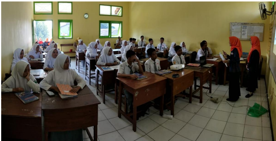
Gambar 3. Suasana Pembelajaran di Kelas XII IPS 2

Setelah penjelasan materi selesai, tim pengabdian mengajak siswa-siswa untuk membentuk kelompok yang terdiri dari 3 siswa, serta mengambil smartphone masing-masing untuk mengakses Quizlet . Evaluasi yang dilakukan mengenai akuntansi serta tentang institusi tim pengabdian untuk cek apakah mereka konsentrasi mendengarkan penjelasan dari pengenalan sampai materi jurnal penyesuaian. Soal Quizlet ada pada gambar 4.