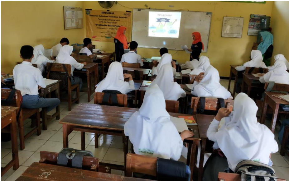
Gambar 2. Penyampaian Materi Jurnal Penyesuaian di Kelas XII IPS 2

Setelah suasana kelas dapat dikendalikan, barulah mahasiswa memberikan penjelasan tentang contoh soal jurnal penyesuaian, beserta langkah pengerjaannya. Suasana pembelajaran dapat dilihat pada Gambar 2 dan 3.