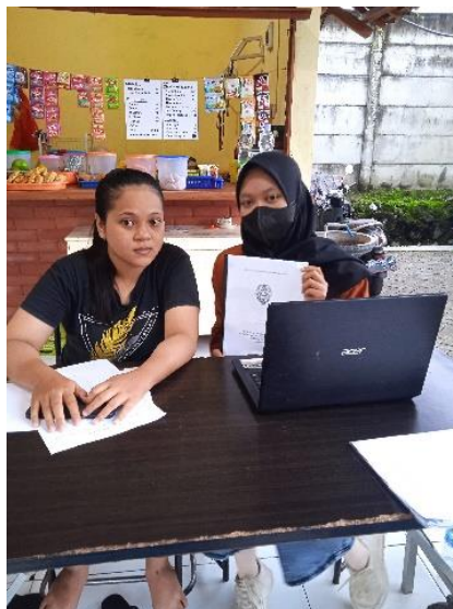
Gambar 3. Pelaksanaan Kegiatan Pelatihan

Pelatihan laporan keuangan sederhana menggunakan aplikasi Buku Kas ini dilakukan pada tanggal 6-9 Februari 2023 dan tahap evaluasi pada tanggal 14 dan 17 Februari 2023. Pelatihan diawali dengan memberikan penjelasan kepada pelaku UMKM mengenai manfaat dan tujuan pembuatan laporan keuangan bagi UMKM. Setelah itu dilanjutkan dengan penjelasan mengenai bagaimana langkah langkah penyusunan laporan keuangan sederhana. Kemudian memberikan pelatihan pengoperasian Aplikasi Buku Kas untuk mempermudah para pelaku UMKM dalam menyusun laporan keuangan sederhana.