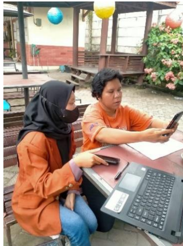
Gambar 4. Pelaksanaan Pelatihan Aplikasi Buku Kas