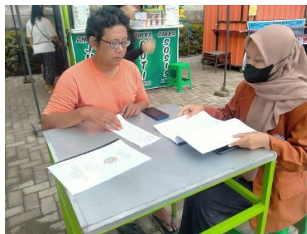
Gambar 5. Pelaksanaan Evaluasi Pelatihan

Sesi selanjutnya setelah pelatihan pengoperasian Aplikasi Buku Kas adalah sesi diskusi dan pendampingan langsung kepada pelaku UMKM untuk mengatasi permasalahan yang mungkin di temukan selama kegiatan pelatihan berlangsung. Pada awalnya dalam metode pelatihan ini tidak terdapat sesi diskusi dan pendampingan, namun jika hanya penjelasan saja maka peserta akan sulit memahami materi yang telah disampaikan, sehingga pemateri mengadakan sesi diskusi dan pendampingan langsung kepada peserta agar lebih maksimal dalam memahami pembuatan laporan keuangan.