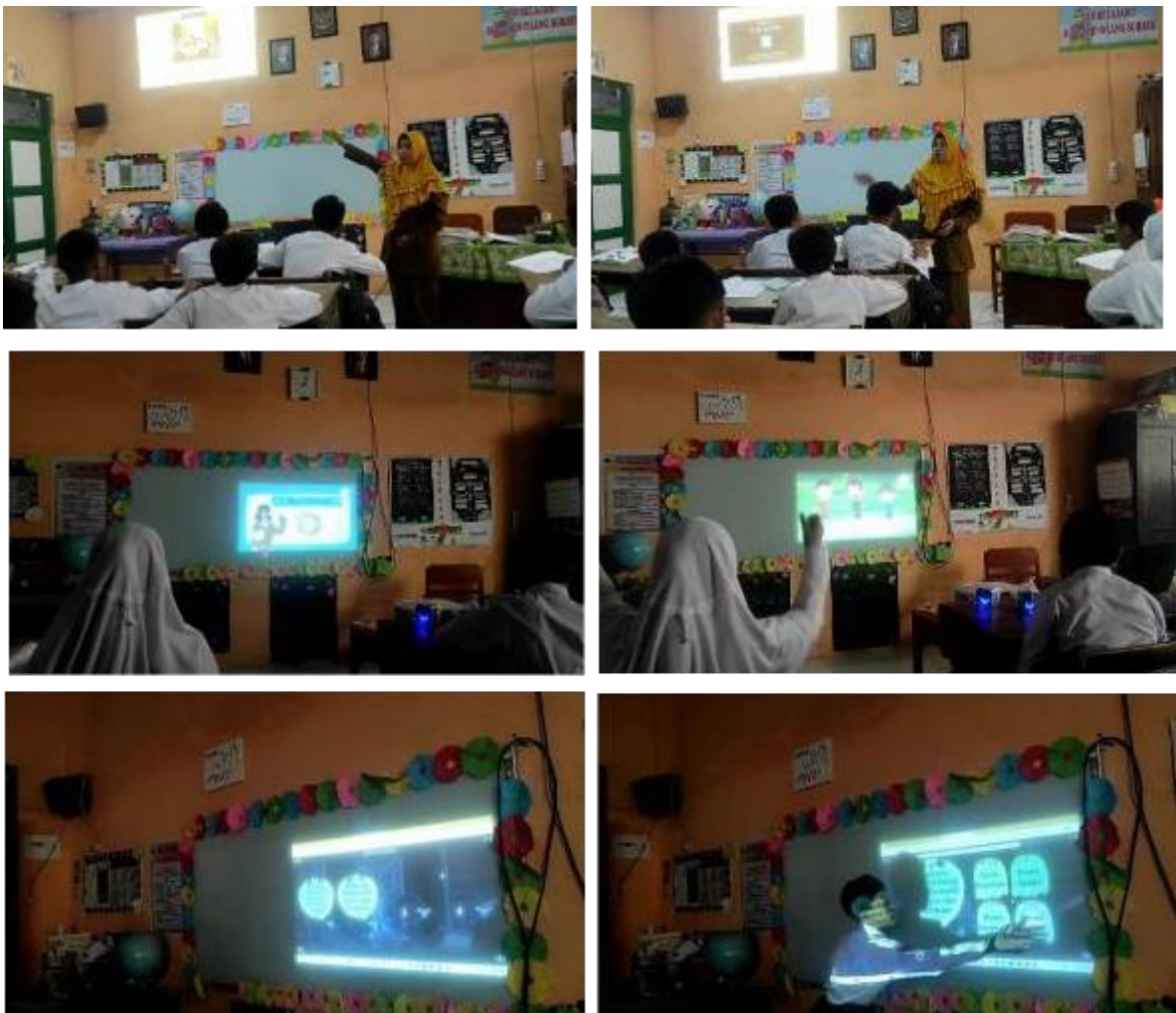
Gambar 4. Pendampingan Guru saat Mengimplementasikan Modul Pembelajaran Digital pada Siswa di Kelas

Berikut merupakan dokumentasi pada saat pendampingan implementasi modul pembelajaran digital pada siswa di kelas.