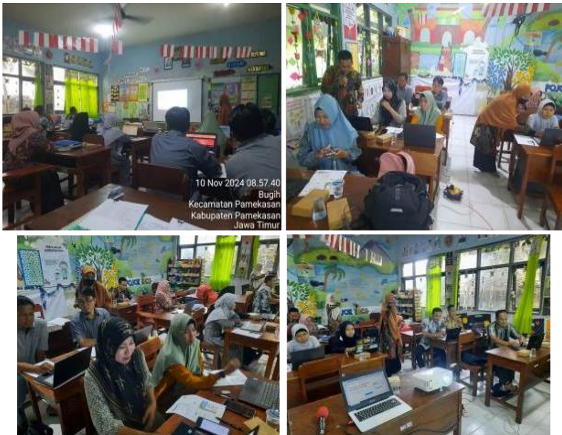
Gambar 1. Pendampingan Pembuatan Kuis Interaktif dan Modul Pembelajaran Digital

Berikut tampilan beberapa hasil karya peserta berupa kuis interaktif dan modul pembelajaran digital.