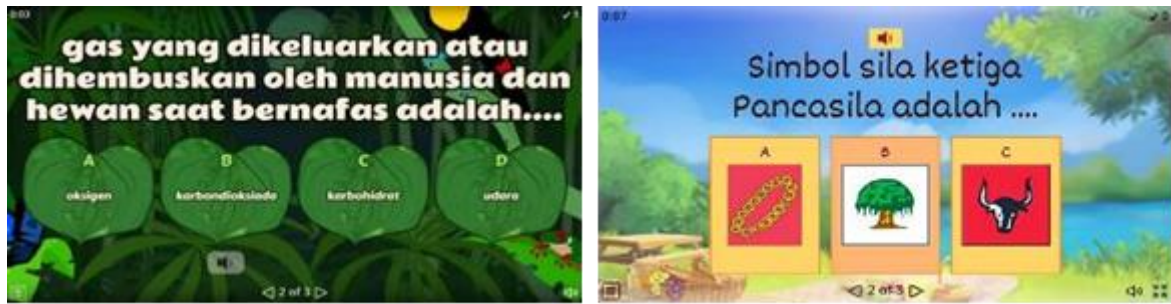
Gambar 2. Beberapa Contoh Kuis Interaktif Hasil Karya Peserta