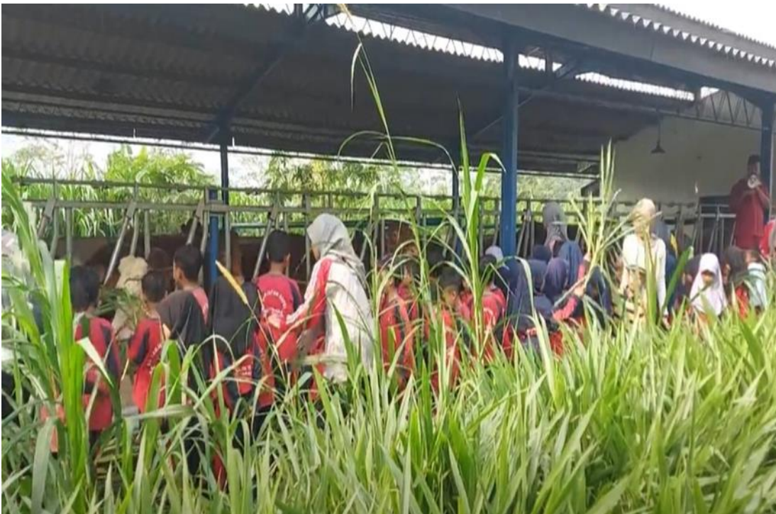
Gambar 5. Peserta Melakukan Field Trip Di Kandang Sapi Milik Dinas Peternakan dan Kesehatan Hewan Provinsi Jawa Tengah