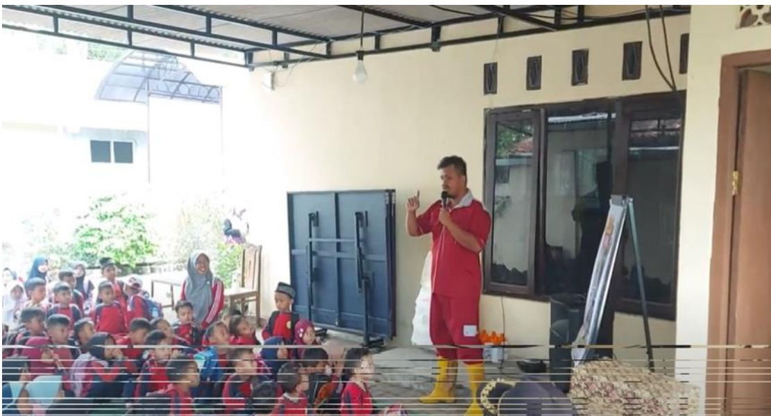
Gambar 3. Penyampaian Materi dari Dinas Peternakan dan Kesehatan Hewan Provinsi Jawa Tengah