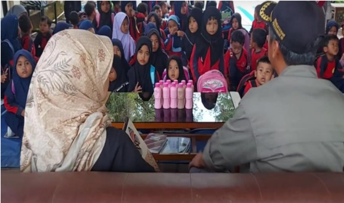
Gambar 4. Pengenalan Produk Olahan dari Dinas Peternakan dan Kesehatan Hewan Provinsi Jawa Tengah