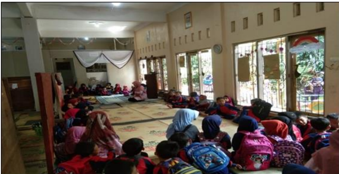
Gambar 2. Kegiatan Sosialisasi Penanaman Nilai Entrepreneurship

Pelaksanaan sosialisasi ini bertempat di Gedung PAUD Mutiara Kids Desa Traji Kabupaten Temanggung. Kegiatan ini dilakukan dengan menyampaikan materi dan demonstrasi. Kegiatan sosialisasi dan pelatihan dimulai dengan tahap perkenalan narasumber dari tim PkM, kemudian dilanjutkan dengan pemberian materi kepada masyarakat. Seluruh peserta PkM diberikan wawasan mengenai entrepreneurship dan nilai-nilai karakter berwirausaha sejak usia dini.