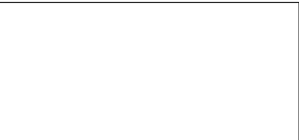
Gambar 2 Acara di buka oleh Kepala dan Ketua Adat Desa Singapadu Kaler Bali