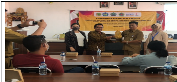
Gambar 1 Menjalin kerjasama Pengabdian Kepada Masyarakat antara Universitas dan Pemerintah Desa Singapadu Kaller

evaluasi pada tahap ini, pada tahap ini tim pengusul melakukan review apa saja yang masih kurang terkait dengan pemahaman Sumber daya Manusia dalam pengelolaan BUMDes sehingga perlu di lakukan pendampingan di periode selanjutnya untuk keberlanjutan pelaksanaan program pengabdian masyarakat. Tahap terakhir yang dilakukan yaitu tahap terminasi. Pada tahap ini merupakan tahap akhir dari pelaksanaan program pengabdian kepada masyarakat. Sehingga pada tahap ini diharapkan semua target program yang direncanakan dapat tercapai. Dalam tahap ini berisi penutupan kegiatan dan pembuatan laporan akhir pengabdian masyarakat. Hasil dari kegiatan ini berdampak pada peningkatan pemahaman sumber daya manusia dalam pengelolaan BUMDes dari yang belum paham mengarsip dan mencatat keuangan sampai bisa membuat laporan keuangan.