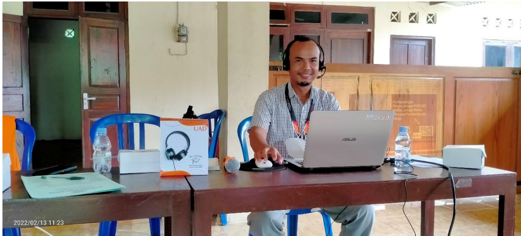
Gambar 6 Dosen pelaksana program pengabdian memanfaatkan headset untuk perekaman audio podcast

Kedua , faktor yang menghambat pelaksanaan program ini adalah keterbatasan sarana dan prasarana pengembangan podcast. Pada saat pelaksanaan, kami hanya mengandalkan alat perekam yang tersedia di handphone atau aplikasi online. Selain itu, pemuda Karang Taruna belum terbiasa mengedit hasil rekaman audio agar layak terbit sebagai salah satu episode podcast Suara Grogol 7. Terakhir, pemuda Karang Taruna belum mahir memanfaatkan aplikasi anchor.fm sebagai aplikasi penyedia pembuatan podcast.