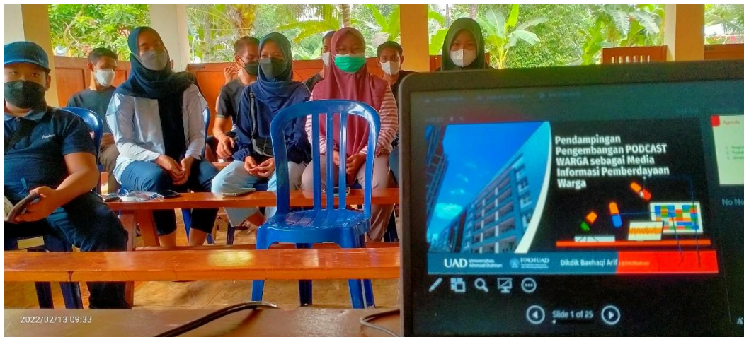
Gambar 1 Pengenalan dan Pelatihan Podcast

Pengenalan podcast dilakukan dengan model training for trainer kepada anggota Karang Taruna Grogol VII Parangtritis Kretek Bantul. Tujuannya adalah agar setelah mengikuti pelatihan mereka dapat menularkan pengetahuan dan keterampilan pengembangan podcast kepada anggota yang lain. Pengenalan dan pelatihan dilaksanakan pada hari Minggu, 14 Februari 2022 mulai pukul 09.00-12.00 WIB di Balai Dusun Grogol VII Parangtris Kretek Bantul. Kegiatan ini diikuti anggota karang taruna dengan pendampingan mahasiswa KKN Reguler 88 Unit VIII.C.2 Grogol VII, sebagaimana ditunjukkan pada Gambar 1.