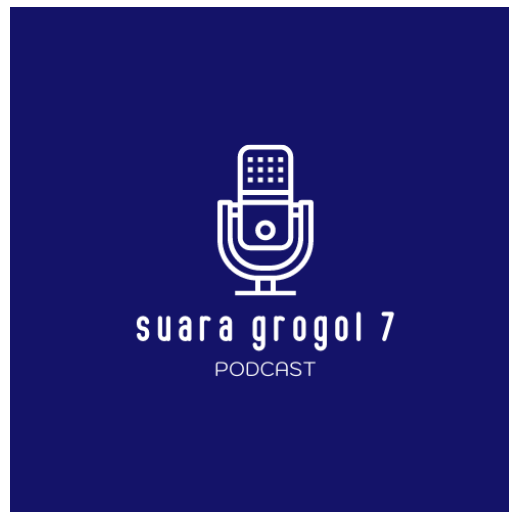
Gambar 2 Logo Podcast Suara Grogol 7