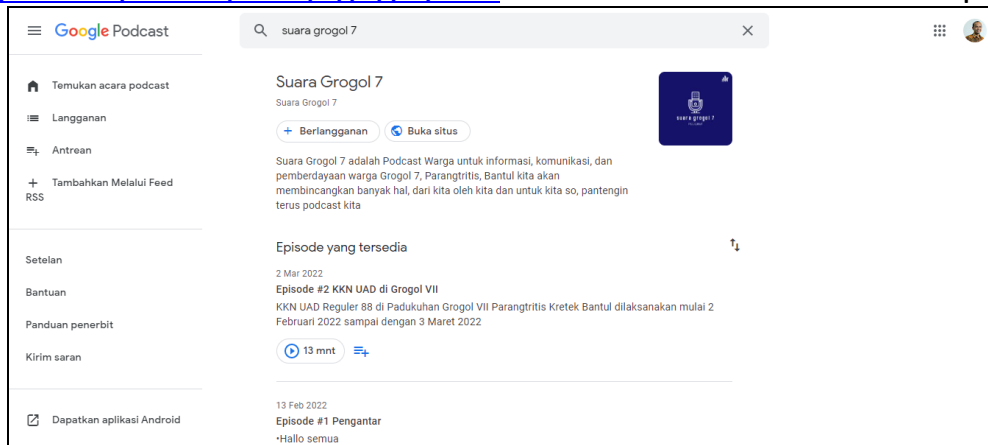
Gambar 3 Suara Grogol 7 di Google Podcasts