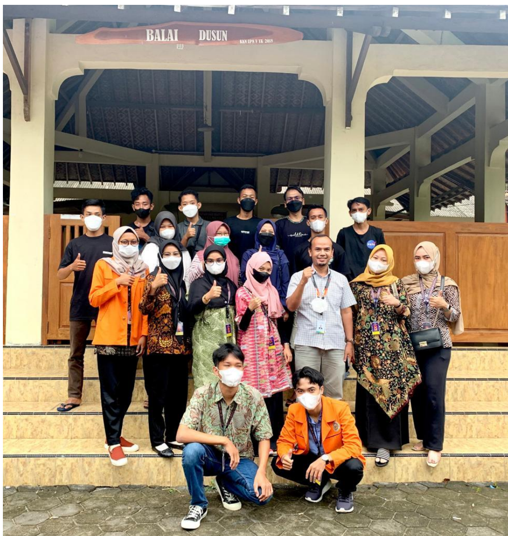
Gambar 5 Tim PKM UAD dan Peserta menyempatkan foto bersama di depan Balai Dusun sesaat setelah pelaksanaan pengenalan dan pelatihan Podcast

Salah satu anggota karang taruna menjadi volunteer mengisi rekaman episode #1 pengantar. Sedangkan satu orang lainnya menjadi host pada episode #2 tentang KKN UAD di Grogol VII.