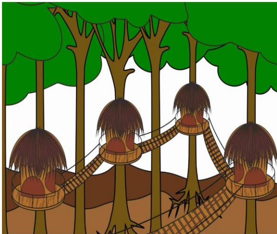
Gambar 1. Rencana Rumah Pohon