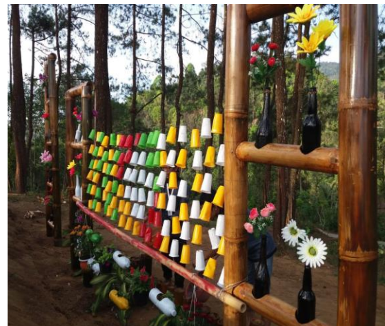
Gambar 4. Realisasi Photo Corner