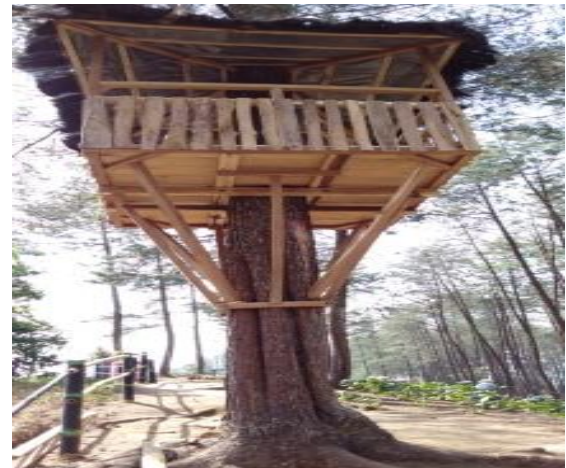
Gambar 2. Realisasi Rumah Pohon

Unsur ketiga dalam living library adalah pengelolaan perpustakaan yang terdiri dari kebersihan, perawatan buku, dan pengawasan pengunjung. Kebersihan perpustakaan serta perawatan buku dari rayap dan kotoran harus dilakukan oleh masyarakat secara piket. Saat ini dana yang tersedia tidak memungkinkan untuk menggaji petugas piket khusus living library . Sedangkan untuk pengawasan buku dari tindakan perusakan dan pencurian oleh pengunjung tidak dapat dilakukan oleh petugas piket secara terus menerus, mengingat penduduk sekitar juga menjadi petani. Oleh karena itu, diharapkan ke depannya pengelola Mloko Sewu dapat membeli kamera CCTV untuk mengawasi pengunjung. Pengelolaan living library membutuhkan penyisihan arus kas masuk di masa mendatang untuk gaji petugas piket dan pembelian CCTV.