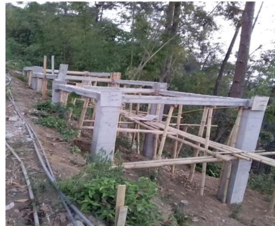
Gambar 6. Realisasi Mloko Sewu Store

Mloko Sewu store ini terbagi menjadi 3 jenis barang dagangan, yaitu pertama , bahan mentah dan oleh-oleh berupa hasil pertanian dan perkebunan khas Mloko Sewu, seperti tanaman hias, bunga, sampai pupuk. Kedua , bahan jadi dan siap konsumsi, seperti kopi yang siap seduh dan jeruk. Ketiga , makanan dan minuman untuk pengunjung yang sekaligus menjadi tempat istirahat.