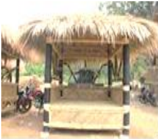
Gambar 5. Rencana Mloko Sewu Store

Sarana yang dibangun untuk menampung hasil bumi masyarakat sekaligus tempat wisatawan membeli makanan dan minuman bernama Mloko Sewu Store. Dana untuk membangun 3 toko bertemakan bangunan tradisional adalah sebesar Rp7.986.000,-, yang merupakan 22,82% dari dana hibah keseluruhan (lihat lampiran 1). Rencana bentuk Mloko Sewu store ada pada gambar 5 dan realisasi terdapat pada gambar 6.