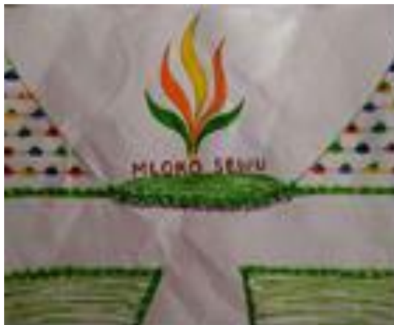
Gambar 3. Rencana Photo Corner Mloko Sewu

Sarana kedua yang dibangun adalah pembuatan photo corner Mloko Sewu yang diharapkan jadi icon wisata. Dana yang dibutuhkan untuk pembuatan icon dan photo corner ini adalah sebesar Rp2.710.000,- (lihat lampiran 1). Dana ini merupakan 7,74% dari dana keseluruhan dengan hasil yang diharapkan sebagaimana yang tercantum pada gambar 3. Realisasi photo corner terdapat pada gambar 4, sedangkan icon wisata Mloko Sewu masih dalam proses pembangunan.