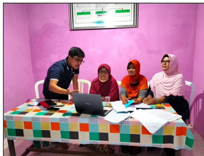
Gambar 2. Pelatihan aplikasi koperasi 4.0