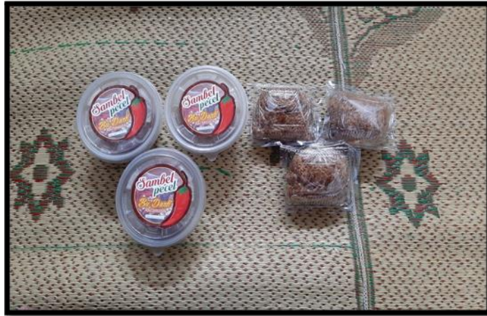
Gambar 2. Kemasan Baru dan Kemasan Lama Sambal Pecel Bu Windarti