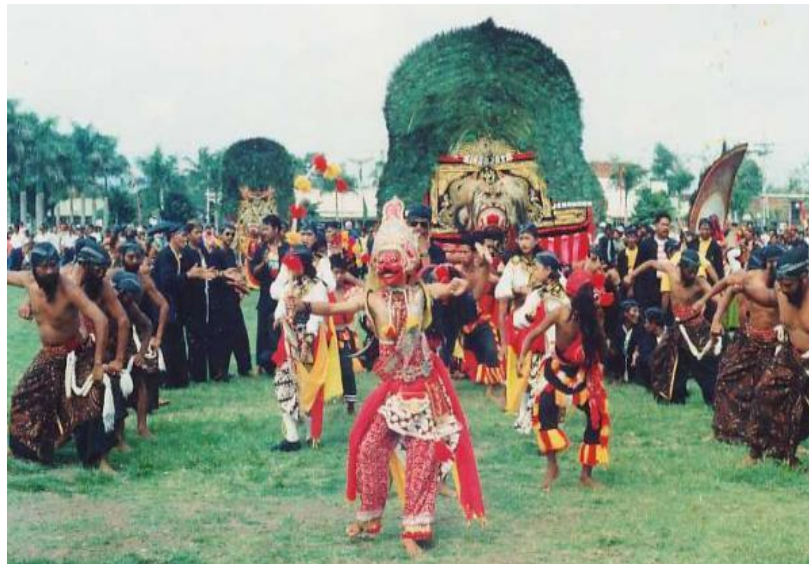
Gambar 2 Reog Setelah Mengalami Perkembangan