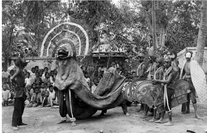
Gambar 1 Reog Sebelum Mengalami Perkembangan