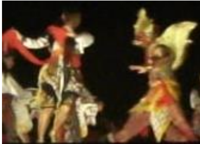
Gambar 4 Klono Sewandono Menari dengan Jatil

adalah romantisme. Hasil observasi mengenai nilai romantisme tersebut dijelaskan sebagai berikut: Klono Sewandono menari dengan beberapa orang Jatil secara bergantian untuk menunjukkan rasa kasmaran Klono Sewandono terhadap Dewi Songgolangit. Hal ini dikarenakan tokoh Dewi Songgolangit dalam setiap pertunjukan tidak pernah ditampilkan.