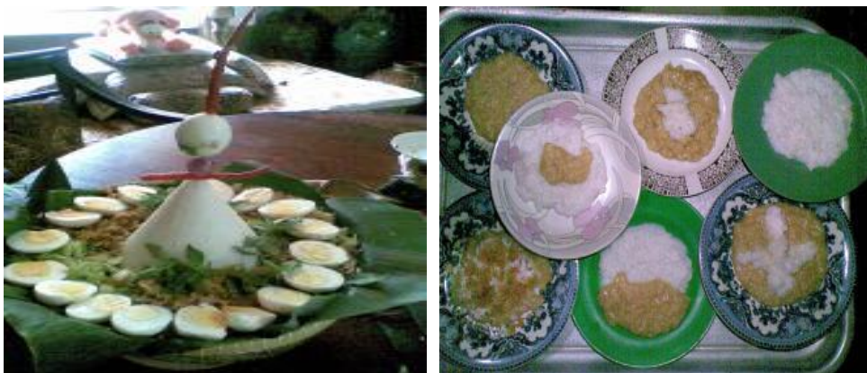
Gambar 2 Ubo Rampe Mitoni/Tingkepan (Selamatan Tujuh Bulanan)

Mitoni atau selamatan tujuh bulanan, dilakukan setelah kehamilan seorang ibu genap usia 7 bulan atau lebih. Dilaksanakan tidak boleh kurang dari 7 bulan, sekalipun kurang sehari.