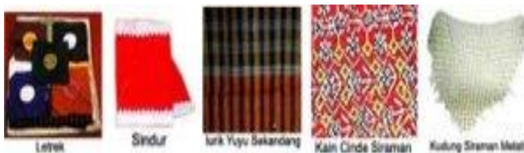
Gambar 10 Perlengkapan Tingkepan