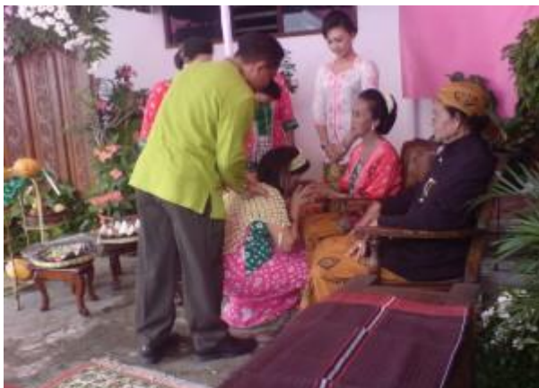
Gambar 7 Sungkem kepada Calon Nenek

Para ibu yang jumlahnya tujuh orang, yang terdiri dari sesepuh terdekat. Upacara dipimpin oleh ibu yang sudah berpengalaman.