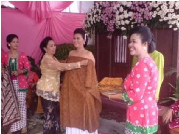
Gambar 9 Mematut Kain

Satu meja yang ditutup dengan kain putih bersih, di atasnya ditutup lagi dengan bangun tolak, kain sindur, kain lurik, yuyu sekandang, mayang mekak atau letrek, daun dadap srep, daun kluwih, daun alang-alang. Bahan bahan tersebut untuk lambaran waktu siraman.