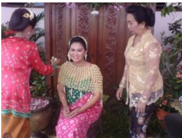
Gambar 8 Siraman