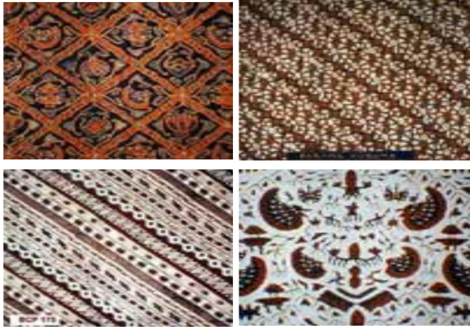
Gambar 4 Motif Kain