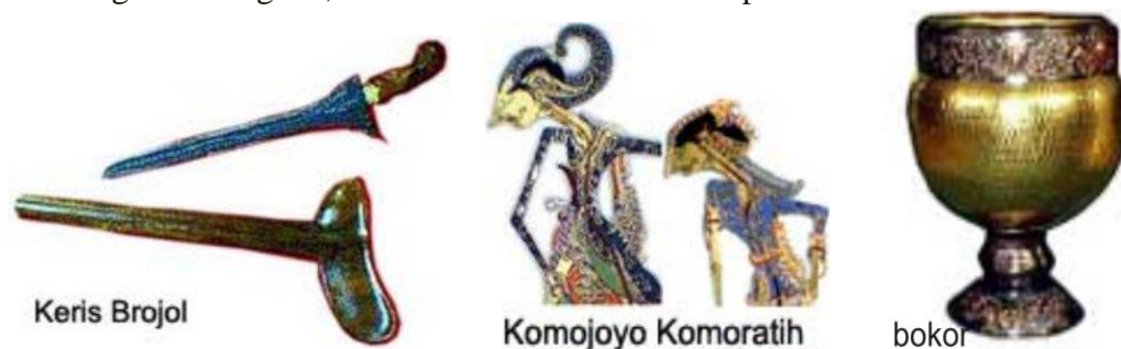
Gambar 6 Keris Brojol, Komojoyo Komoratih, dan Bokor

Mori dipakai sebagai busana dasar sebelum berganti-ganti nyamping, dengan maksud bahwa segala perilaku calon ibu senantiasa dilambai dengan hati bersih. Jika suatu saat keluarga tersebut bahagia sejahtera dengan berbagai fasilitas atau kekayaan atau memiliki kedudukan maka hatinya tetap bersih tidak sombong atau congkak, serta senantiasa bertakwa kepada Tuhan.