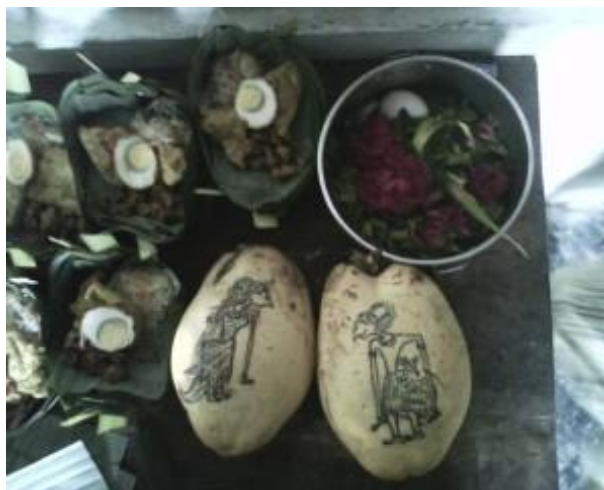
Gambar 1 Contoh Membuat Makanan Tertentu Seperti Takir Plontang, Kembang Setaman, dan Kelapa Muda

Jayabaya akhirnya menasihati kepada pasangan itu agar melakukan ritual. Namun sebagai syarat pokok, mereka harus rajin menyembah secara khusyu' kepada Gusti Allah, selalu berbuat yang baik dan suka menolong serta welas asih kepada sesama. Selain itu, mereka harus menyucikan diri dengan cara mandi suci memakai air yang berasal dari tujuh sumber. Kemudian berpasrah diri lahir batin serta dibarengi permohonan kepada Gusti Allah, apa yang menjadi kehendak mereka, terutama untuk kesehatan dan kesejahteraan si bayi. Supaya mendapatkan berkah dari Gusti Allah, sebaiknya diadakan sesaji (bersedekah dengan membuat makanan tertentu guna menambah keyakinan makbul dalam berdoa kepada Allah/ untuk penguat doa dan penolak bala' ).