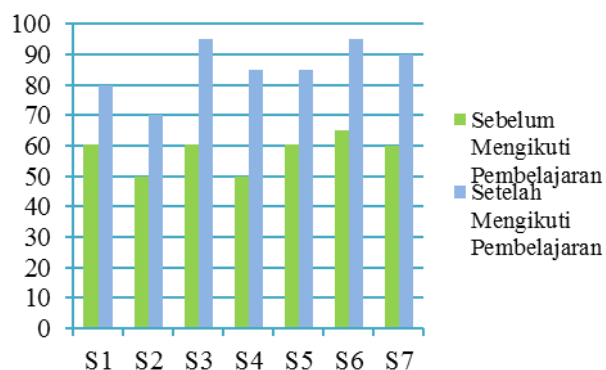
Gambar 2. Grafik Perbandingan Hasil Sikap Peduli Lingkungan Uji Coba Lapangan

Berikut diagram yang menggambarkan peningkatan sikap peduli lingkungan siswa pada uji coba lapangan.