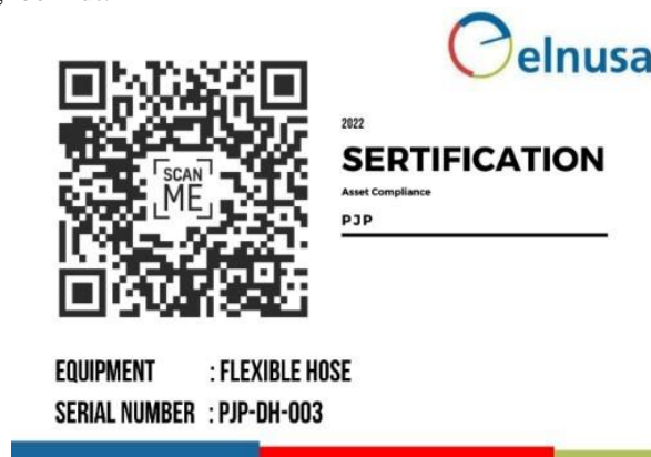
Gambar 3. Qr Code untuk Sertifikasi

Tahap do dilakukan dengan menyajikan langkah - langkah implementasi dan menjelaskan kebutuhan pengguna (tim proyek) didapatkan dari hasil wawancara yaitu tim proyek membutuhkan kemudahan dalam pencarian sertifikat melalui smartphone , sehingga tidak perlu menghubungi tim aset compliance support terlebih dahulu. Implementasi qr code sebagai berikut: