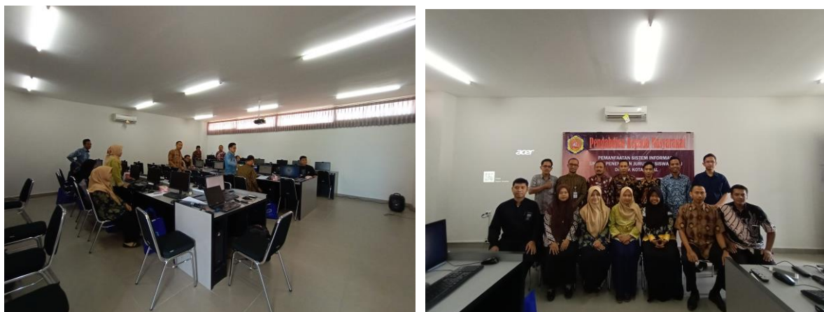
Gambar 2. Photo Kegiatan Pengabdian

diberikan kesempatan untuk melakukan diskusi dengan tim pelaksana kegiatan dan mahasiswa. Selain itu pada sesi ini juga diberikan arahan langsung oleh instruktur (ketua pelaksana kegiatan) terkait langkah-langkah penggunaan setiap menu dan fitur yang ada dalam sistem informasi, hal ini dimaksudkan agar semua peserta dapat menggunakan sistem dengan baik untuk menghindari human error .