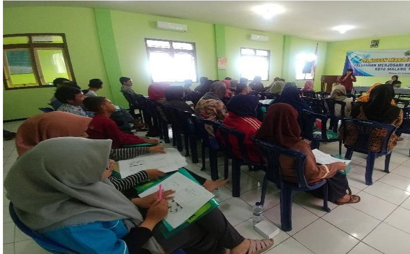
Gambar 2. Peserta Penyuluhan Manajemen Organisasi