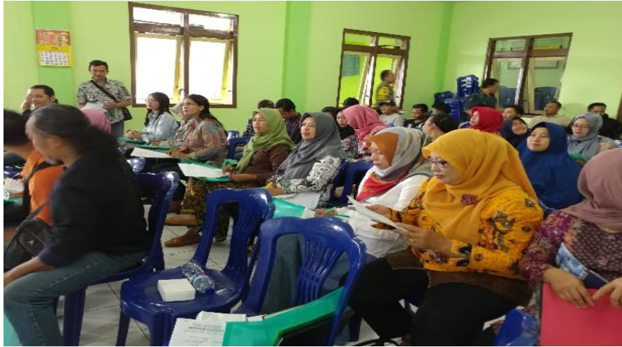
Gambar 3. Pelatihan Sistem Pengarsipan

diberikan adalah pengarsipan dan penyusunan neraca sederhana. Hal ini mengingat waktu yang diberikan hanya 3 (tiga) jam sehingga bila ada peserta yang kurang paham maka dipersilahkan untuk bertanya di luar acara pelatihan.