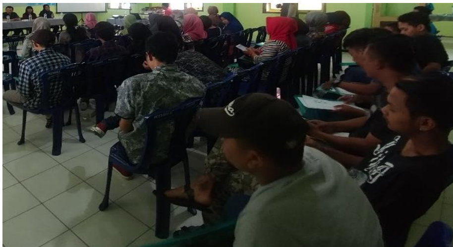
Gambar 4. Pelatihan Sistem Keuangan Organisasi Sederhana

Setelah pelatihan, peserta diberi angket untuk mengetahui sampai sejauh mana kepuasan peserta setelah diberikan pengetahuan mengenai manajemen organisasi. Untuk mengelola data yang diperoleh dari angket, menggunakan metode statistik deskriptif yang mendeskripsikan data yang terkumpul.