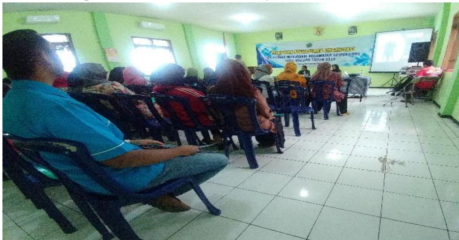
Gambar 5. Penyampaian Materi SAK- ETAP

Ada 2 lagi yang harus disertakan yaitu Laporan Laba Rugi dan Laporan Perubahan Ekuitas. Keduanya tidak disampaikan dalam pelatihan karena organisasi yang dibina adalah organisasi jenis nirlaba yang tidak mengutamakan profit. Sehingga hanya catatan-catatan keuangan sederhana yang dikelola dan diketahui semua anggota organisasi, tidak dipublikasikan ke masyarakat luas.