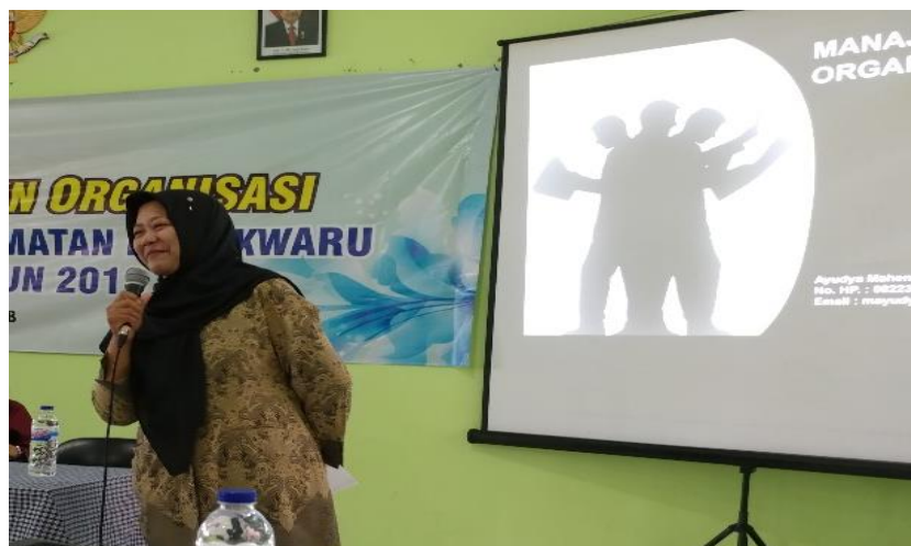
Gambar 1. Penyuluhan Manajemen Organisasi

Pelatihan diberikan dengan tujuan mengasah softskill peserta dan untuk mengevaluasi sejauh mana peserta dapat memahami dan mempraktekkan manajemen di organisasinya. Dibentuk kelompok berdasarkan unit pelaksananya dengan maksimal 2 (dua) orang anggota per kelompok untuk mempraktekkan bagaimana mengelola administrasi persuratan, pengarsipan, serta sedikit mengenai bentuk neraca keuangan sederhana.