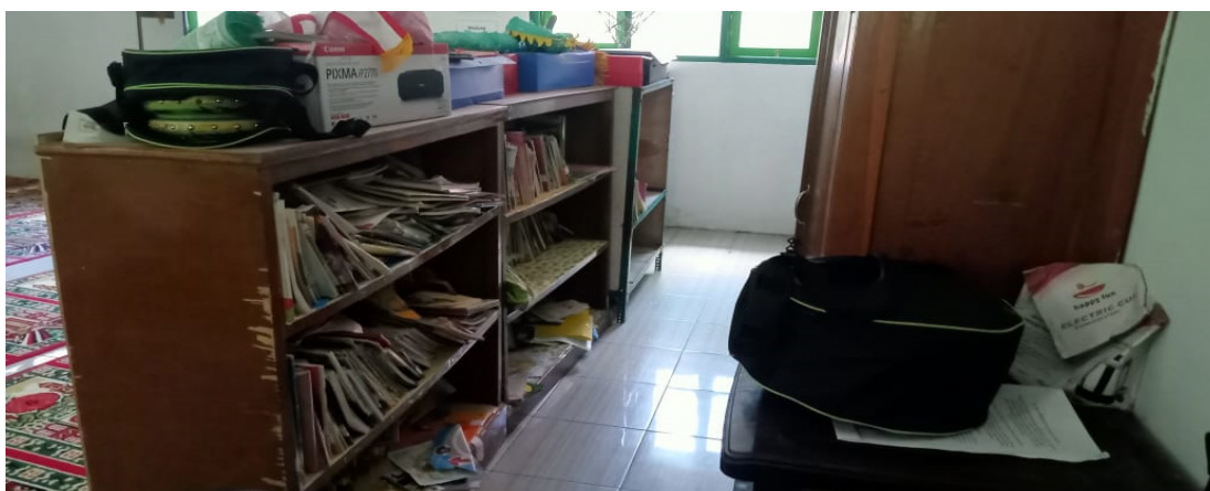
Gambar 1. Lokasi dan Kondisi Perpustakaan

Sedangkan untuk lokasi dari perpustakaan yang melayani hampir 30 siswa tersebut berada di dekat kantor kepala sekolah dan kantin. Ruangan kantin yang berukuran 4 x 6 meter itu sudah memiliki beberapa lemari buku dan rak-rak penyimpanan dokumen. Beberapa kondisi yang ada sangatlah tidak higienis, seperti lantai dan lemari, diiring dengan pengelolaan buku yang tidak baik. Hal ini terlihat dari beberapa buku yang tidak layak pakai, serta buku-buku yang disediakan di perpustakaan banyak yang tidak sesuai dengan pelajaran atau jenis bukunya.