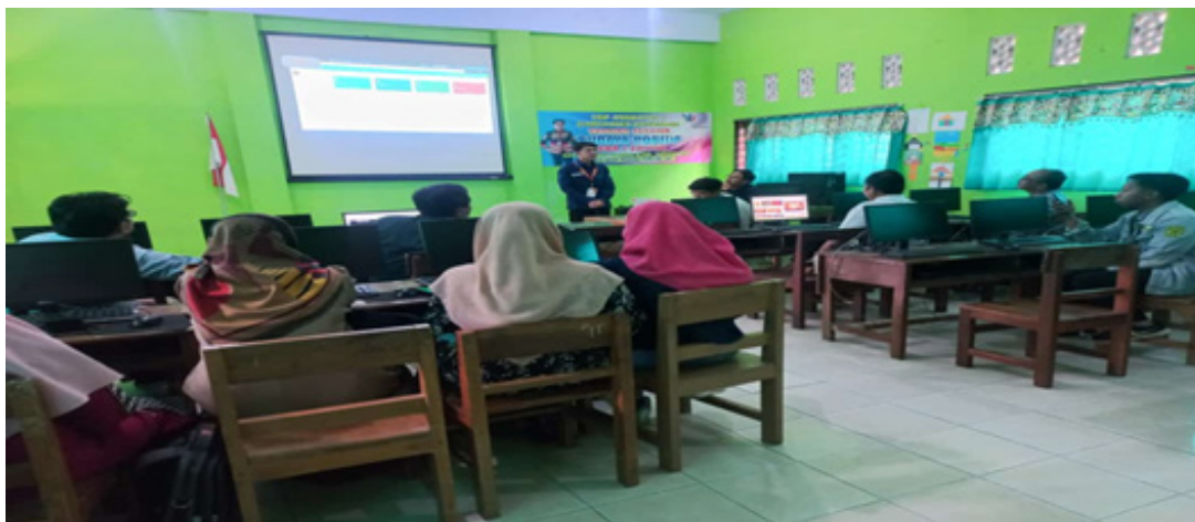
Gambar 2. Penyuluhan kepada Guru dan Staff dalam Digitalisasi Perpustakaan

Operasional. Kegiatan selanjutnya adalah memberikan pembinaan kepada staf perpustakaan dan memantaunya setiap jam buka perpustakaan, yaitu waktu Istirahat. Kegiatan pendampingan ini dilakukan untuk membiasakan para staf dalam pengoperasian perpustakaan. Berikut ini adalah kegiatan penyuluhan yang dilaksanakan di SDN 1 Sawoo.