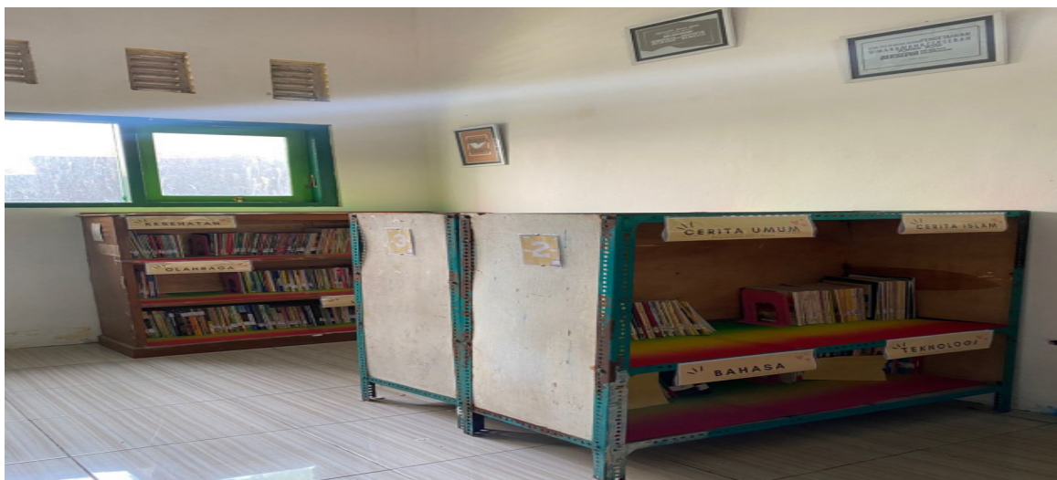
Gambar 3. Foto Penempatan Buku Buku sesuai jenis buku

Selanjutnya pada minggu ketiga dilaksanakan dalam pendampingan dan pemantauan staf di perpustakaan SDN 1 Sawoo, mereka diberikan pengarahan tentang standar pemakaian sesuai arahan dari tim pelaksana pengabdian masyarakat. Berikut hasil pendampingan untuk petugas Perpustakaan.