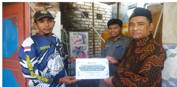
Gambar 3. Serah Terima Alat

Maka dari itu, dibutuhkan teknologi filterisasi air payau menjadi air tawar/bersih