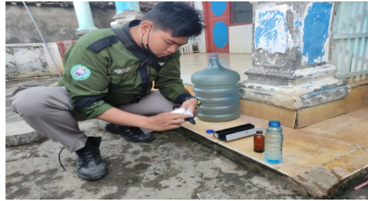
Gambar 2. Dokumentasi Pengujian Sampel Air

pembuatan dan instalasi alat MRO, maka dilakukan survei tempat dan pengambilan sampel air untuk mengecek kadar suhu, kadar TDS ( Total Dissolved Solids ) dan kadar Salinitas di Dusun Pandansari, Desa Kedungpandan, Kecamatan Jabon, Kabupaten Sidoarjo.