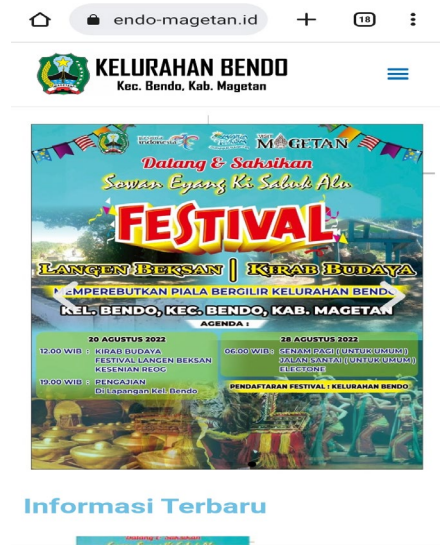
Gambar 8. Tampilan halaman utama dari Website kelurahan Bendo melalui web browser smartphone