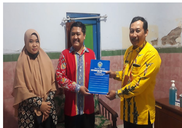
Gambar 6. Penyerahan dokumen administratif Domain dan Hosting ke pihak kelurahan Bendo

Sebelum melakukan proses tahap 4, gambar 6 tim melakukan serah terima dokumen administrative Domain dan Hostin kepada mitra yaitu pihak kelurahan Bendo yang lakukan oleh ketua tim Pengabdian kepada Masyarakat dengan Lurah Bendo. Kegiatan selanjutnya Tim melakukan Pelatihan administrasi dan management pengelolaan Website kelurahan dengan tenaga operator yang telah di tunjuk oleh pihak kelurahan.