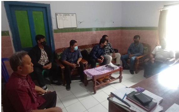
Gambar 3. Wawancara dan analisis kebutuhan Website kelurahan Bendo

informasi apa saja yang dibutuhkan masyarakat umum tentang kelurahan bendo.