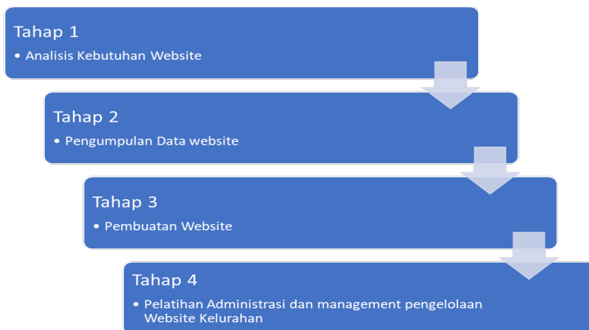
Gambar 2. Tahapan Pelaksanan Kegiatan Pengabdian kepada Masyarakat

Susunan dari tim pelaksana kegiatan Pengabdian kepada Masyarakat terdiri dari 5 orang yang merupakan 3 tenaga dosen yang bertugas untuk melakukan observasi, analisis data, membuat konten dari Website , melatih perangkat kelurahan dan Menyusun laporan kegiatan pengabdian, yang dibantu oleh 2 mahasiswa dalam proses pembuatan dan melakukan pelatihan pengelolaan Website .