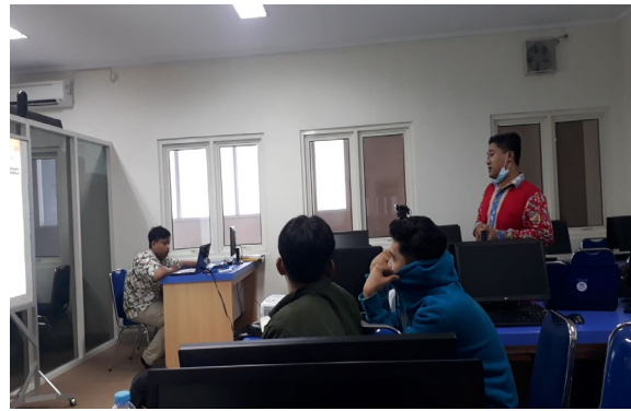
Gambar 5. Suasana pada saat pembuatan Website Kelurahan

Pada tahap 3 dalam gambar 5, tim membangun Website kelurahan bendo dengan konsep yang dibuat berdasarkan Analisa kebutuhan yang telah di lakukan oleh tim pada tahap 1 dan sesuai dengan data – data kelurahan Bendo yang telah tim peroleh dari pengumpulan data pada tahap 2.