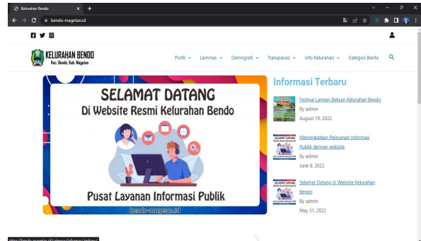
Gambar 7. Tampilan halaman utama dari Website kelurahan Bendo melalui web browser computer desktop atau laptop

Menu Kategori Berita yang berisi Kategori Berita terdapat kumpulan – kumpulan berita yang di unggah oleh admin Website Kelurahan Bendo.