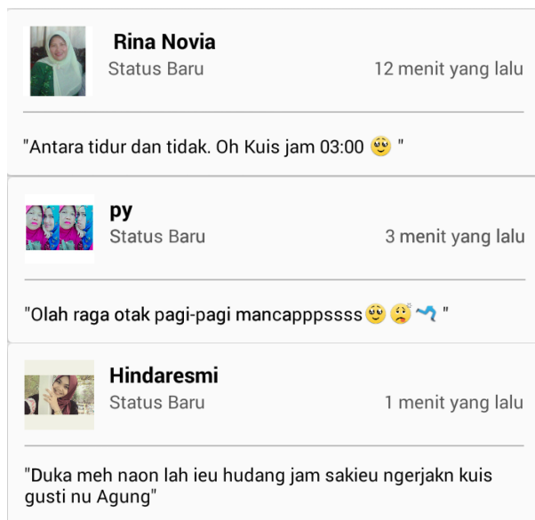
Gambar 2. Posting status BBM mahasiswa dengan respon negatif

Namun, apapun respon dari mahasiswa, nampaknya langkah ini merupakan awal untuk menerapkan pembiasaan yang baik kepada mahasiswa. Waktu dini hari yang mereka habiskan untuk tidur, bisa dimanfaatkan untuk hal yang lebih mulia, dengan belajar dan berdoa. Awal waktu memang akan terasa begitu berat, namun perlahan jika mahasiswa mampu konsisten, niscaya itu menjadi kebiasaan yang baik.