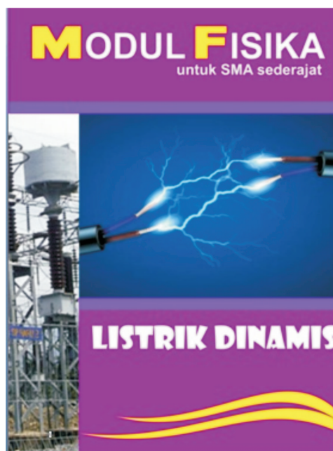
Gambar 1 desain sampul modul

Design produk yang dihasilkan adalah sebagai berikut: