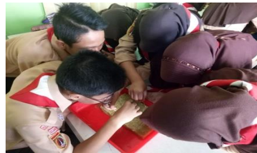
Gambar 4. Praktik Penyemaian Benih pada Rockwool

Data – data dari hasil penelitian dikumpulkan dan dianalisis dengan metode analisis data kualitatif bersifat deskriptif. Pada pengisian angket siswa disajikan 6 aspek penilaian diantaranya Pemanfaatan Media pada Hidroponik, Proses Penanaman Hidroponik, Pemahaman/ Penguasaan Materi Hidroponik, Kepedulian Siswa terhadap Lingkungan, Minat Siswa pada Pengembangan Teknologi Hidroponik, dan Pelestarian Lingkungan. Dari keenam aspek penilaian berisi 6 s/d 7 indikator sebagai penilaian siswa selama mengikuti pelatihan hidroponik. Metode yang digunakan untuk mengetahui data tersebut yaitu menggunakan behavioral checklist