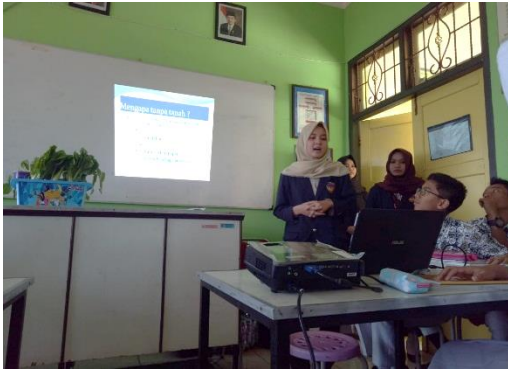
Gambar 2. Penyampaian Materi dan Simulasi

Pada hari kedua dijadwalkan untuk memberikan materi yang bersifat teknis, yaitu penyemaian. Sebelum dilakukan penyemaian pada rockwool, dilakukan terlebih dahulu perendaman benih. Pendapat Prihantoro (1996: 37) yang menyatakan bahwa persemaian dilakukan dengan merendam benih terlebih dahulu. Perendaman tersebut difungsikan untuk mengetahui kualitas dari benih yang dipakai, apabila benih saat direndam ini terapung berarti menandakan bahwa kualitasnya kurang bagus karena benih yang mengapung memiliki berat yang lebih ringan berarti pasokan nutrisinya sedikit. Setelah itu dilakukan penyemaian dengan cara memotong rockwool menjadi ukuran 2,5x2,5 cm menggunakan cutter/gergaji dan pada tiap rockwool dilubangi untuk disemaikan benih sebanyak 1-2 benih per rockwool. Setelah itu diberi air secukupnya tidak samapi menggenang. Apabila diberikan air terlalu banyak, benih akan cepat membusuk karena masa awal pertumbuhan benih belum terlalu membutuhkan nutrisi yang banyak karena selnya pun masih sedikit. Pada tahapan ini, dilakukan pembagian kelompok untuk memudahkan dalam penanaman supaya efisien. Siswa dengan jumlah 34 akan dibagi menjadi 6 kelompok. Masing-masing kelompok terdiri dari 5-6 siswa. Setiap kelompok akan melakukan penyemaian dengan benih tanaman yang berbeda-beda, untuk