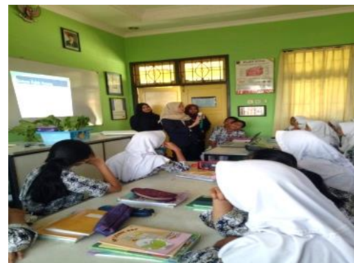
Gambar 1. Penyampaian materi dan simulasi