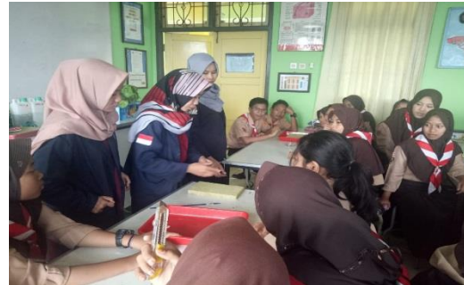
Gambar 3. Praktik Pemotongan Rockwool

kelompok 1-3 melakukan penyemaian bibit selada merah ( lollo rossa ), sedangkan untuk kelompok 4-6 melakukan penyemaian bibit sawi pagoda ( tak ke cai ). Hari ketiga merupakan rangkaian akhir dari keseluruhan pelatihan. Di hari terakhir ini, peserta melakukan pengecekan tanaman yang sudah disemai.