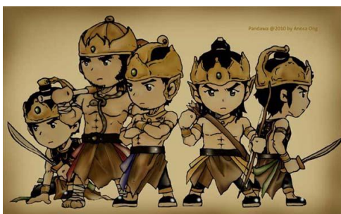
Gambar 4.1 Tokoh Pandawa