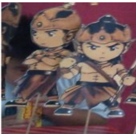
Gambar 4.2 WEDUS GEMBEL (Wayang Kardus Gembira dan Belajar)