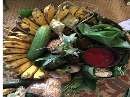
Gambar 4. Sesaji Persembahan Sendang (Dokumentasi pribadi, 2019)

jarik, paku, janur atau daun pohon kelapa yang muda berjumlah 10, air putih, teh, kopi, rokok, bunga setaman, wangi-wangian, uang receh, kendi, bdan besekek atau tempat yang terbuat dari bambu.