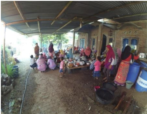
Gambar 3. Proses Masyarakat Mengadakan Persiapan Upacara Sendang

mPlati dan Ki Gambreng warga yang memiliki hajat atau acara harus membentuk panitia acara atau bahasa Jawanya angkroh . Panitia terdiri atas ketua biasanya ketua RT, wakil ketua, perangkat desa, sesepuh desa, juru kunci sendang dan anggota panitia. Panitia mempersiapkan hajat yang akan dilaksanakan oleh tuan rumah sekaligus menyiapkan berbagai makanan yang diberikan juru kunci sendang.