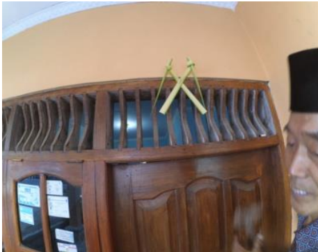
Gambar. 5 Janur Penolak Balak

yaitu depan pintu rumah, sisi samping rumah dan sisi belakang rumah.