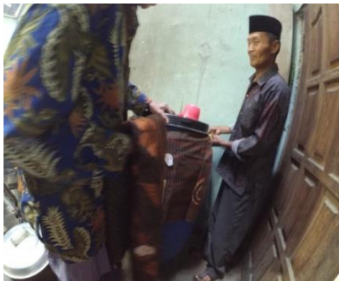
Gambar. 6 Pengikatan Kain Jarik

pernikahan lalu tambir besar yang pertama diletakan di kamar pengantin oleh juru kunci sendang.