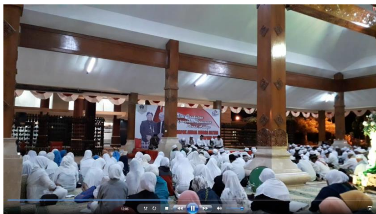
Gambar 1. Screenshot video interaktif (Dokumen Peneliti)

wawancara dengan ketua paguyuban para anggota kesenian Ambiya. kesenian Ambiya Kabupaten Blitar dan