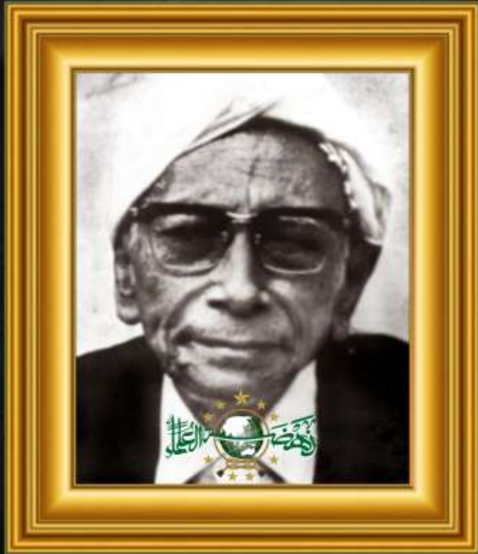
KH. Wahab Chasbullah (Periode 1947 - 1971)