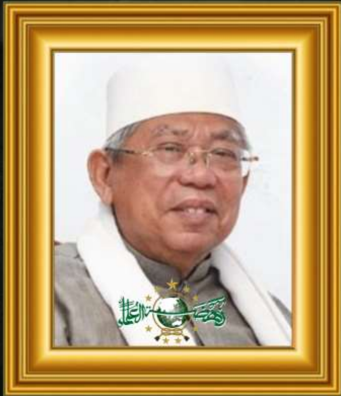
KH. Ma'ruf Amin (Periode 2015 - )