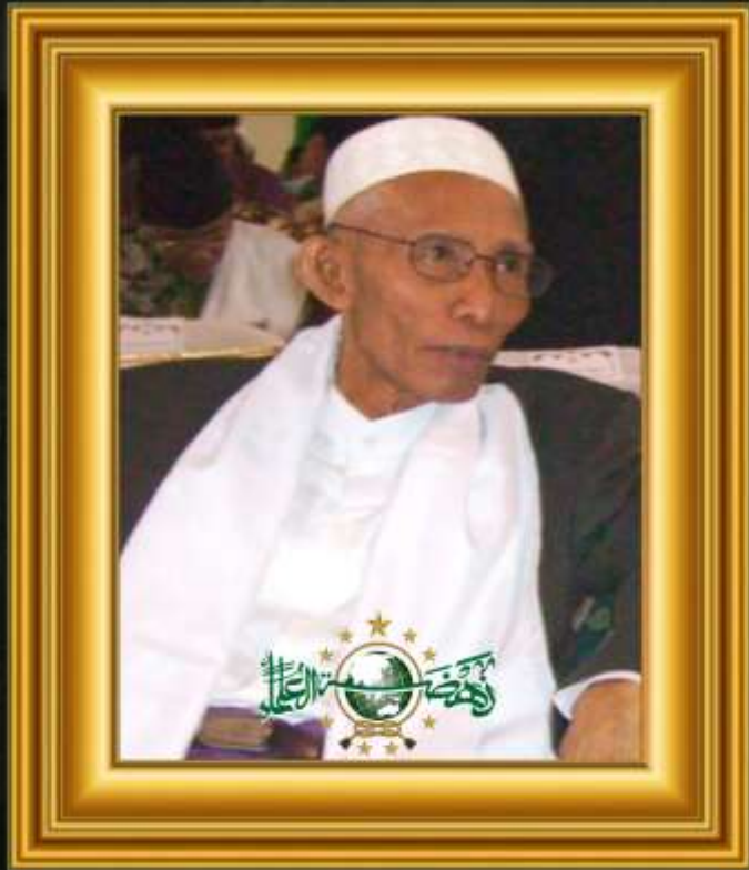
KH. Mohammad Ahmad Sahal Mahfudz (Periode 1999 - 2014)