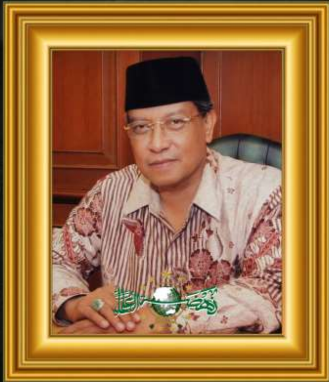
KH. Said Aqil Siradj (Periode 2010 - )