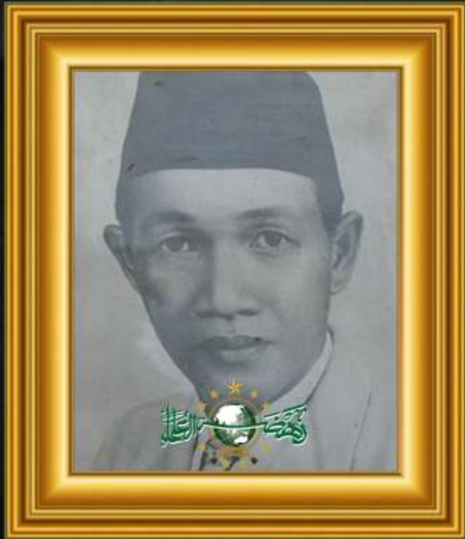
KH. Idham Chalid (Periode 1952 - 1984)