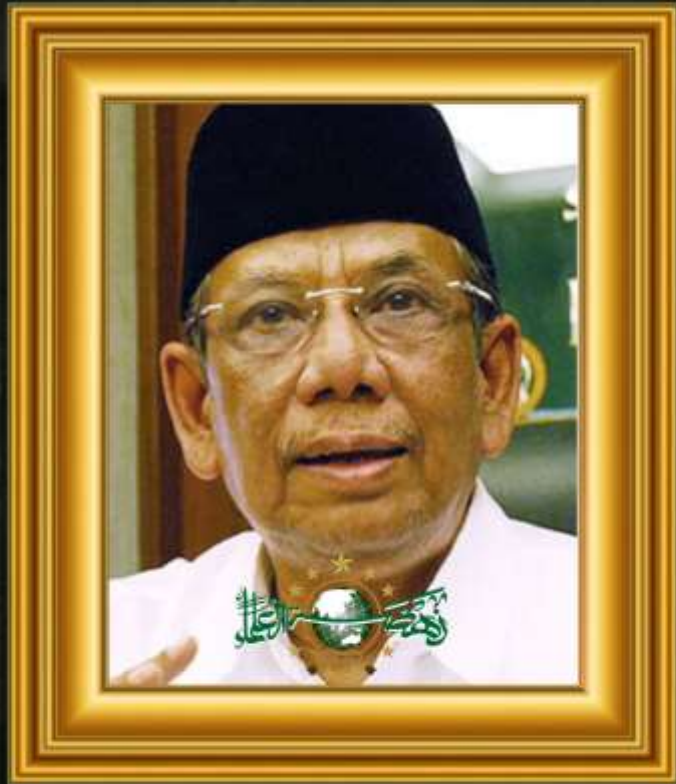
KH. Hasyim Muzadi (Periode 1999 - 2010)