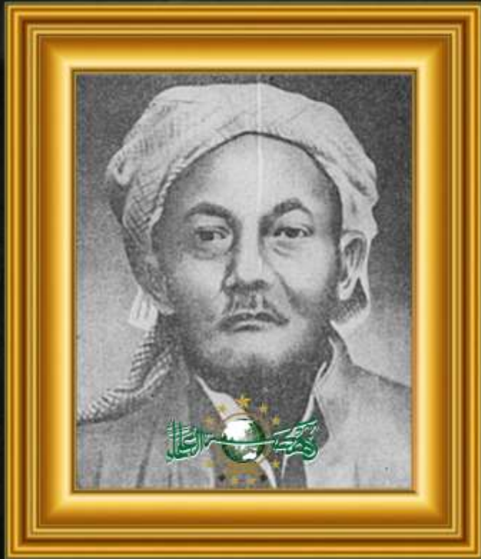
Hadratussyaikh KH. Hasyim Asy-Ariy (Periode 1926 - 1947)