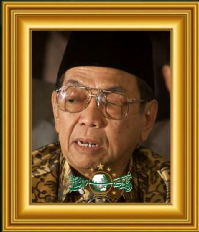
KH. Abdurrahman Wahid (Periode 1984 - 1999)