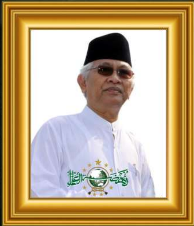
KH. Ahmad Mustofa Bisri (Periode 2014 - 2015)