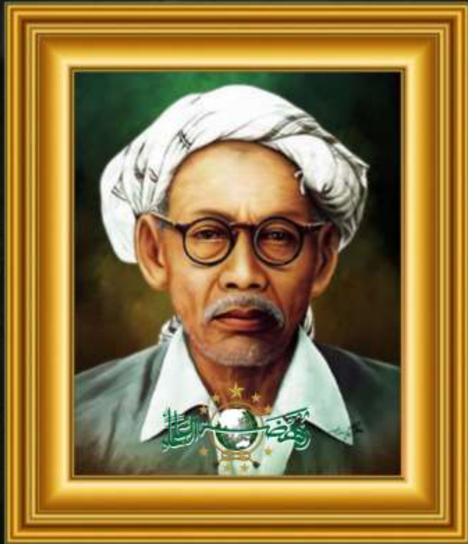
KH. Bisri Syansuri (Periode 1972 - 1980)