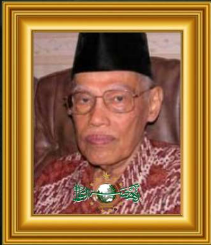
KH. Ali Yafie (Periode 1991 - 1992)