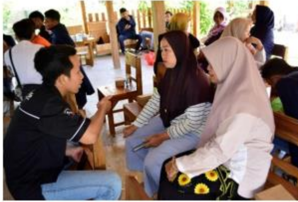
Gambar 2 Pendampingan kepada pelaku usaha UMKM

Pelaksanaan pendampingan ini dilaksanakan di Dusun Gentan Desa Ngrupit yang dilaksanakan bersamaan dengan pelaku UMKM di Desa Ngrupit yang sudah mempunyai produk UMKM. Dalam pelatihan ini juga diperkenalkan bagaimana cara mendaftarkan, mengupload, memasarkan dan menerima orderan shopee dengan benar.