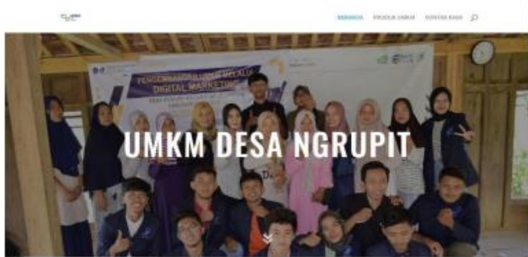
Gambar 3. Tampilan website UMKM Desa Ngrupit

Selain melakukan pendampingan dan pemberdayaan UMKM di Desa Ngrupit juga membuat suatu platform website yang dapat digunakan sebagai media untuk mempermudah dalam proses memasarkan produk UMKM masyarakat Desa Ngrupit. Dalam website ini nantinya diharapkan masyarakat Ngrupit dapat memasukan hasil UMKM nya untuk di pasarkan di masyarakat luas. Dan diharapkan masyarakat luas yang ingin membeli atau ingin melihat hasil UMKM masyarakat Desa Ngrupit dapat melihat melalui website ini.