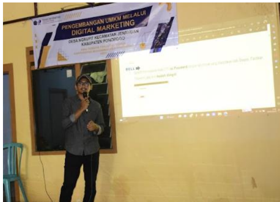
Gambar 1 Kegiatan pelatihan UMKM

Langkah awal pelaksanaan pengabdian ini adalah melakukan obervasi dan mencari data UMKM di Dusun Getan Desa Ngrupit. Untuk melakukan program pendampingan pemberdayaan UMKM di Dusun Getan Desa Ngrupit. Mahasiswa mendatangi dan mensurvey lokasi UMKM yang berada di Desa Ngrupit untuk nantinya di berikan solusi mengenai permasalahan yang berada di masing-masing UMKM.