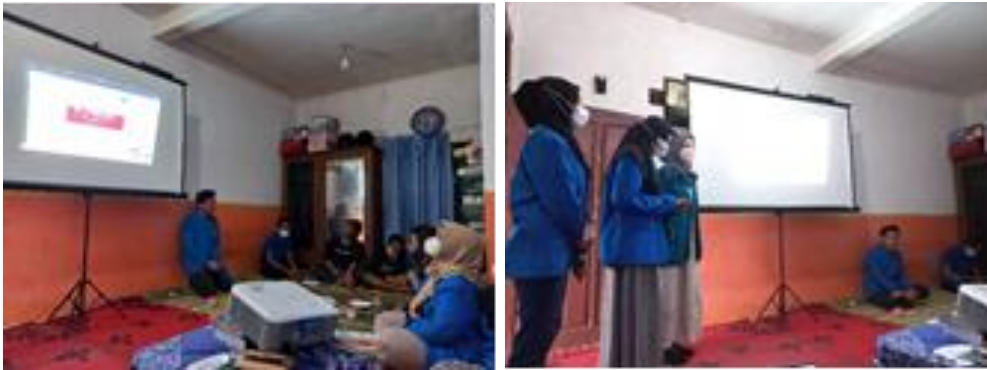
Gambar 3. Penjelasan Materi Digital Marketing Marketplace Shoope

Pada Gambar 2. menunjukkan proses pelaksanaan kegiatan pemberangkatan yang dimulai dari titik jemput GOR Cendekia Universitas PGRI Madiun, sebagai penguatan jiwa nasionalisme sebelum kegiatan dimulai setelah doa bersama secara bersama-sama menyanyikan lagu Indonesia Raya beserta peserta pelatihan untuk memupuk rasa syukur, iman dan taqwa kepada Tuhan Yang Maha Esa; terjalannya kasih sayang kebersamaan, peduli, bersaudara antara sesama; membangun jiwa kebinekaan, toleransi, dan nasionalisme melalui pelaksanaan pengabdian kepada masyarakat dengan tema “kebermanfaatanku untuk Indonesia”.