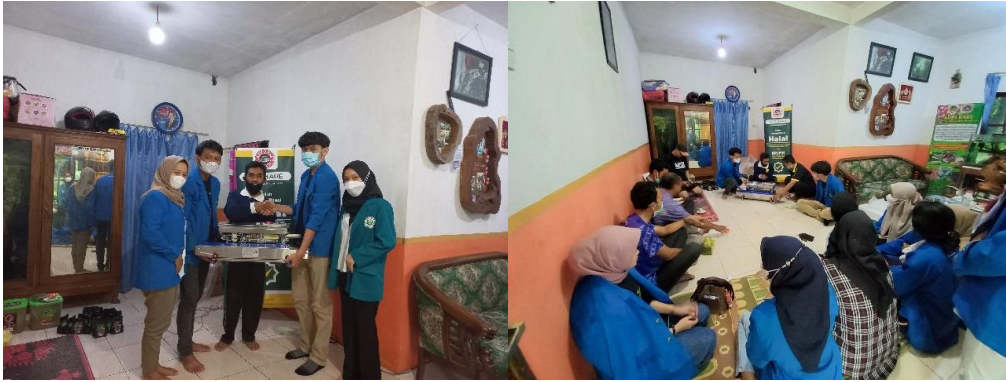
Gambar 5. Penyerahan Mesin Pres Sealer dan Penjelasan Penggunaan Mesin