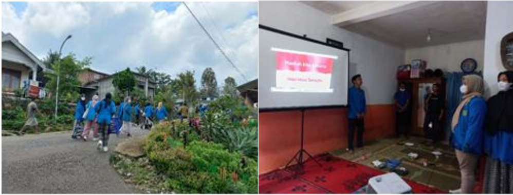
Gambar 2. Proses Pelaksanaan Kegiatan

Pada Gambar 2. menunjukkan proses pelaksanaan kegiatan pemberangkatan yang dimulai dari titik jemput GOR Cendekia Universitas PGRI Madiun, sebagai penguatan jiwa nasionalisme sebelum kegiatan dimulai setelah doa bersama secara bersama-sama menyanyikan lagu Indonesia Raya beserta peserta pelatihan untuk memupuk rasa syukur, iman dan taqwa kepada Tuhan Yang Maha Esa; terjalannya kasih sayang kebersamaan, peduli, bersaudara antara sesama; membangun jiwa kebinekaan, toleransi, dan nasionalisme melalui pelaksanaan pengabdian kepada masyarakat dengan tema “kebermanfaatanku untuk Indonesia”.