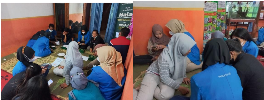
Gambar 4. Praktik Unjuk Kerja Digital Marketing Marketplace Shoope

Pada Gambar 3. menunjukkan bahwa penjelasan materi oleh tim kepada peserta pelatihan kelompok tani Kopi Kare Madiun mengenai marketplace shoope .