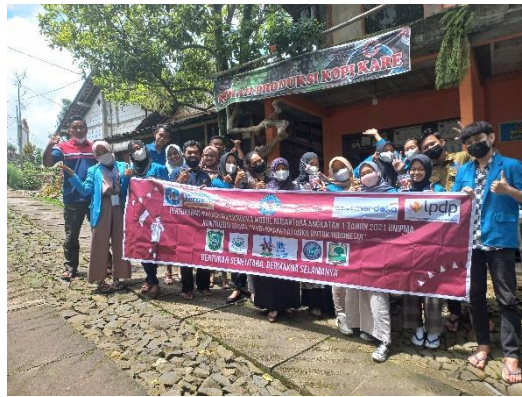
Gambar 6. Foto Kebersamaan Tim Dengan Peserta Pelatihan

Pada Gambar 6 menunjukkan adanya peningkatan rasa syukur, iman dan taqwa kepada Tuhan Yang Maha Esa; terjalin kasih sayang bersama, peduli, bersaudara antar sesama; membangun jiwa kebinekaan, toleransi, dan nasionalisme. Beragamnya suku, bahasa, agama, asal daerah namun bersatu dalam kesamaan.