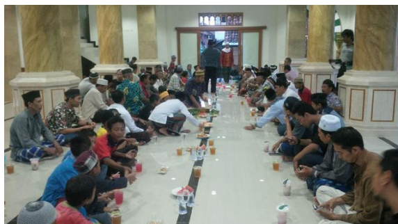
Gambar 5. Suasana Buka Puasa Kampung Kepaon

yakni hari ke 10 , hari ke 20, dan hari ke 30 puasa Ramadhan. Proses memasak makanan tersebut dilakukan oleh ibu-ibu dari masing-masing RT di Kampung Kepaon dan dilaksanakan secara bergiliran. Makanan tersebut dijadikan pada satu tempat yang berisi Nasi, dan terdapat tempat lain dengan ukuran lebih kecil sebagai tempat sayur lauk pauk seperti masakan ayam-ayaman seperti ayam bumbu ganep, ayam panggang, olahan telur rebus atau telur goreng, dan sayur-sayuran seperti urap atau sayuran berkuah. Gambar 5. Suasana Buka Puasa Kampung Kepaon.