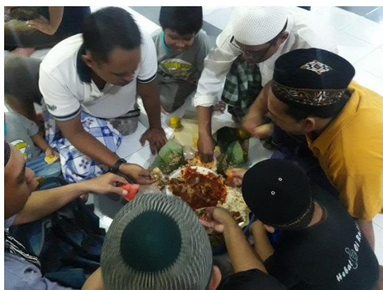
Gambar 6. Potret Megibung Kampung Islam Kapaon