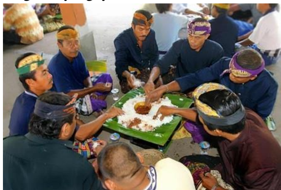
Gambar 4. Tradisi Megibung Umat Hindu

seiring berjalannya waktu dan perkembangan dunia yang semakin pesat para kaum borjuis sudah mulai meninggalkan tradisi tersebut dan menggantikannya dengan memilih untuk memesan makanan melalui catering . Era modern sekarang ini, tradisi megibung untuk masyarakat Bali khususnya umat hindu sudah tidak menjadi keharusan untuk dilaksanakan mengingat masyarakat modern lebih menginginkan segala sesuatu yang bersifat praktis. Gambar Tradisi Megibung di Karangasem dapat dilihat pada gambar Gambar 4. Tradisi Megibung Umat Hindu.