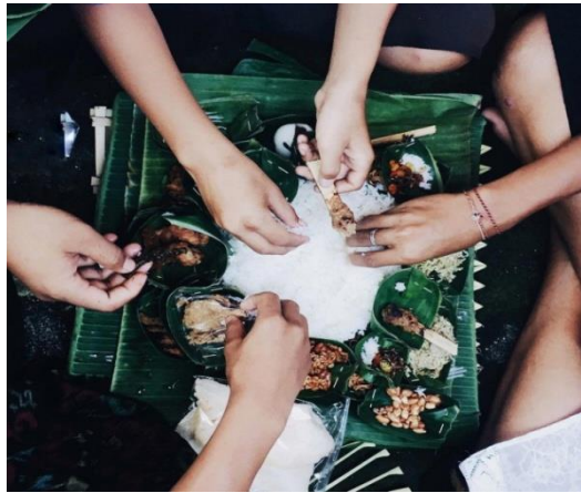
Gambar 3. Menu Megibung Umat Hindu

Megibung dilakukan di Banjar, Dadya atau Pura Dalem dan Pura Puseh. Di Banjar, tradisi megibung dilaksanakan oleh seluruh warga Banjar sedangkan di Dadya dilaksanakan oleh keluarga besar yang memiliki Pura/Sangah yang sama dalam satu ruang lingkup tempat tinggal. Ketentuan waktu pelaksanaan tradisi megibung dilakukan menurut perhitungan bulan (sasih) dan wuku (210 hari). Bagi Masyarakat Bali, Megibung mengandung makna yang sangat krusial terutama dalam hal kebersamaan saling berbagi satu sama lain tanpa melihat kasta dan materi yang dimiliki oleh seseorang. Sayangnya,