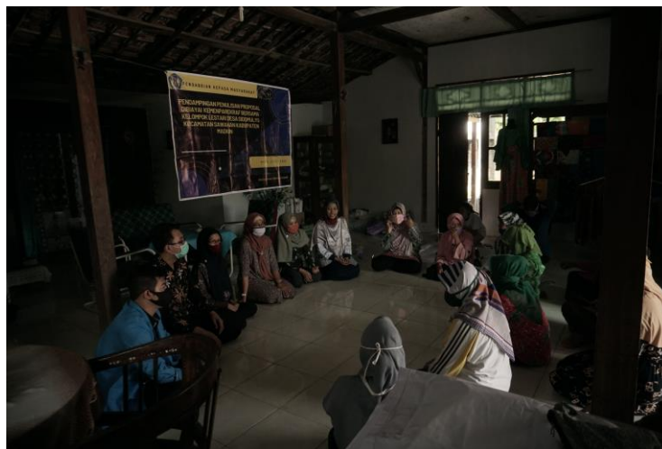
Gambar 1. Pelaksanaan Kegiatan