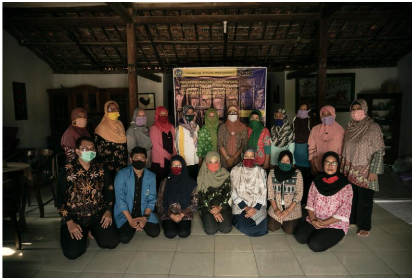
Gambar 3. Sarasehan Bersama Kelompok Batik Lestari